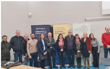
Réunion de lancement du laboratoire commun CATAMAREN le 17 décembre 2024 à l'Université de Lille (Villeneuve-d'Ascq).

Cliquez sur les visuels suivants pour les télécharger en haute définition :