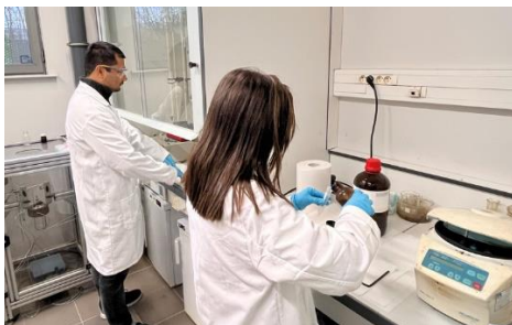
Chercheurs du laboratoire commun sur le campus de l'Université de Lille (Villeneuve-d'Ascq).