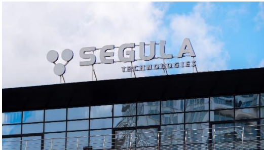
Vue du siège du groupe SEGULA Technologies à Nanterre (Paris)